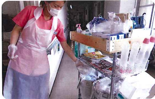
排泄物の取り扱い