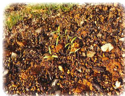
コスモスの芽が出てきました♪