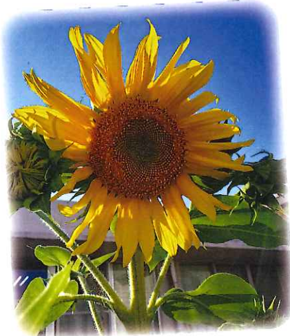
一足早くヒマワリが咲きました☆

通所リハでは通所とB棟の間にあるスペースを使い、お花や野菜を育て利用者の方にも、 植ええ・草むしり・収穫 などに参加していただいております。 利用者の方々に色々教えて頂きながら行っており、既にキュウリがどんどん収穫できています♪