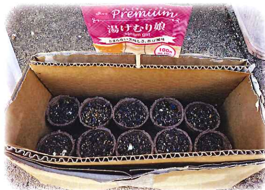
枝豆の赤ちゃんも成長中♪