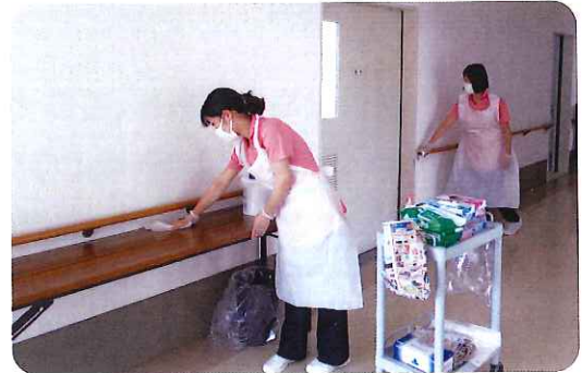
クリネルでの環境整備