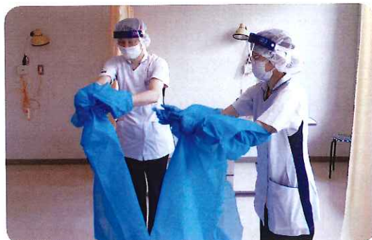
防護具着脱訓練の様子