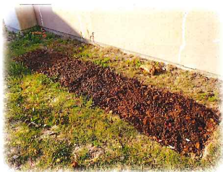
何も無いように見えますが…