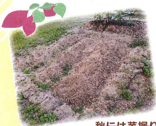
秋には芋掘りも予定しています♪

空地だった場所をたくさんの方にご協力頂きながら畑作りを始めました。 今では「畑に行こう!」と利用者さんから言われる事も☆ 外の空気に触れて、皆さんリフレッシュされています♪ 今後も野菜やお花で四季を感じ、楽しんで頂けるように計画中です!!♪