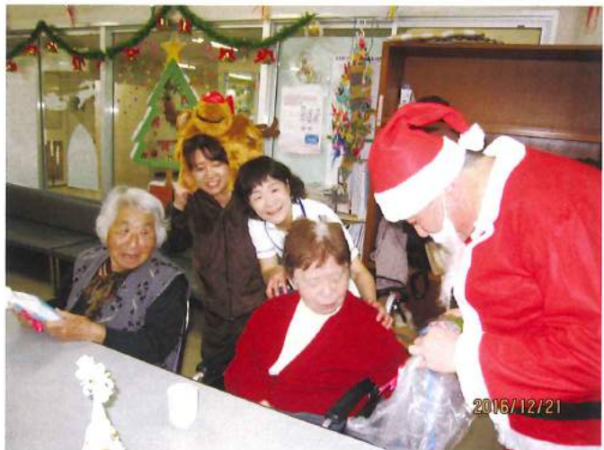
サンタクロースから利用者さまへプレゼント！