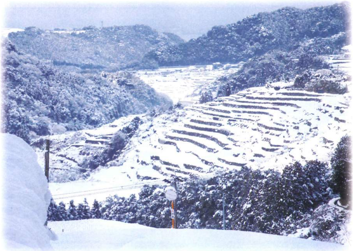
彼杵町俵坂 棚田の雪景色